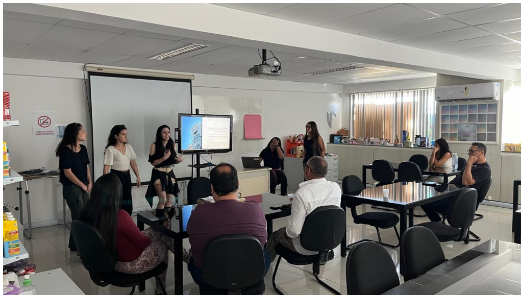
Figura 15 - Apresentação dos alunos para a banca de avaliação