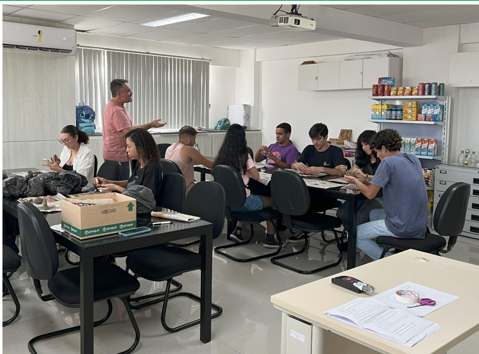
Figura 11 - Alunos e visitantes A importância da argila na arte terapia.