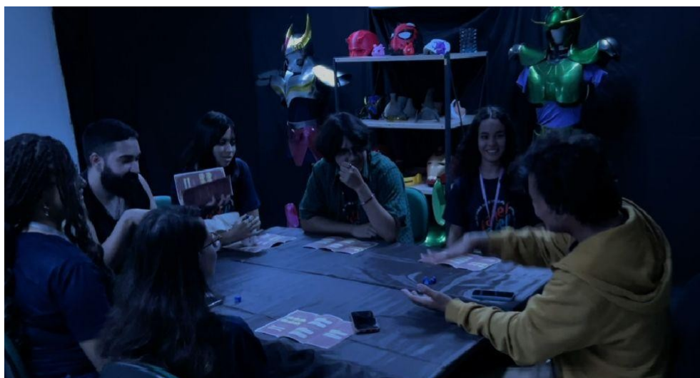
Figura 10 - Alunos e visitantes jogando na sala do Projeto de RPG.