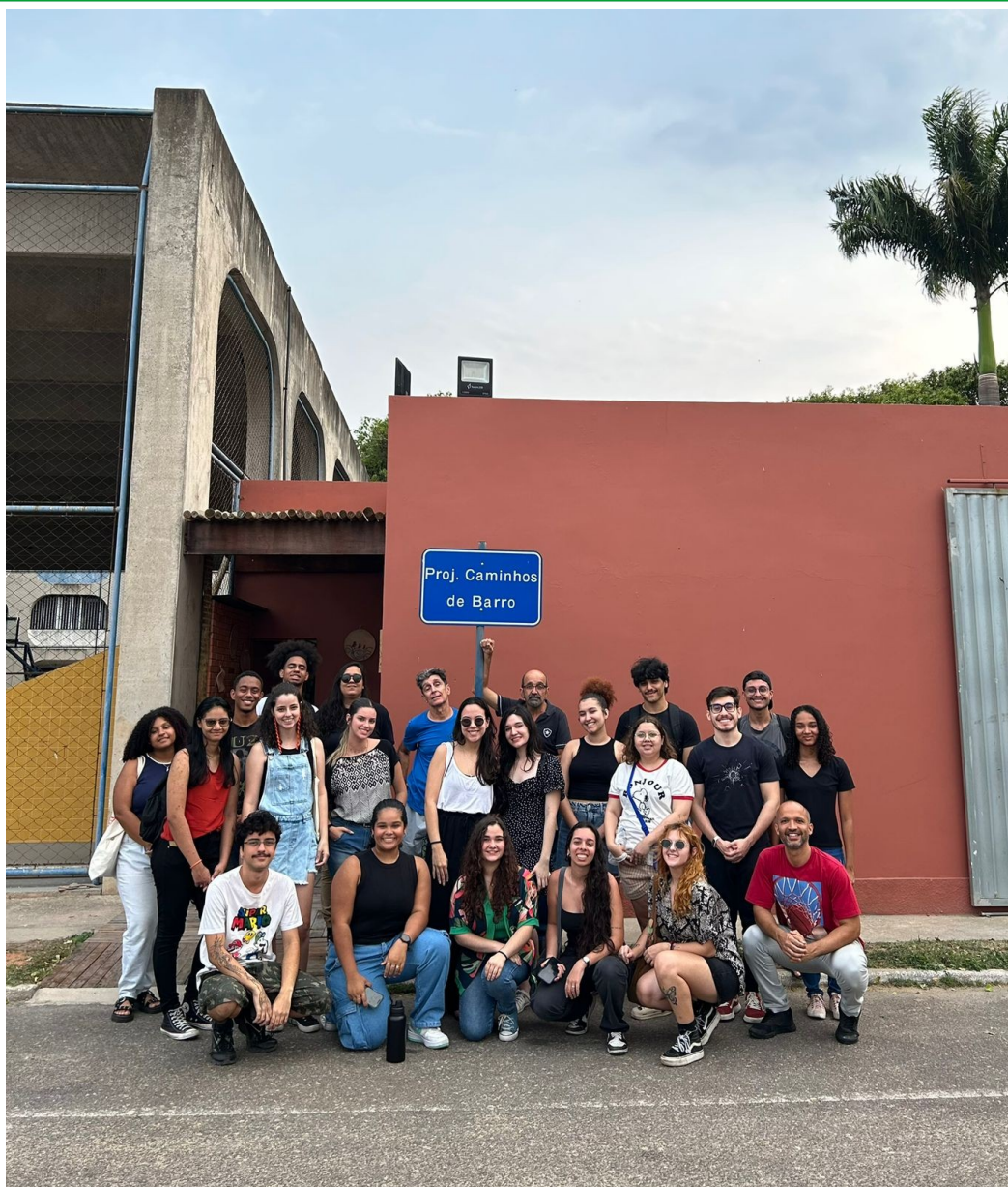
Figura 14 - Alunos na visita técnica à UENF para desenvolvimento do projeto