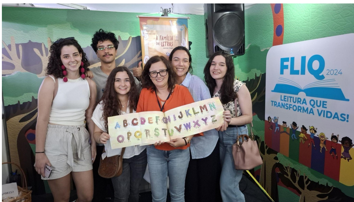
Figura 19 - Alunos e cliente no lançamento do livro “A família das letras” na Feira do Livro em Quissamã de 2024.

b) Projeto de Editorial "Campos em Trovas" - 2024.1