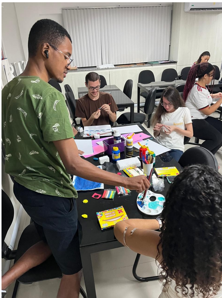
Figura 02 - Calouros na oficina de guache

Link para o portal de eventos: https://eventos.iff.edu.br/calouradadesign20241