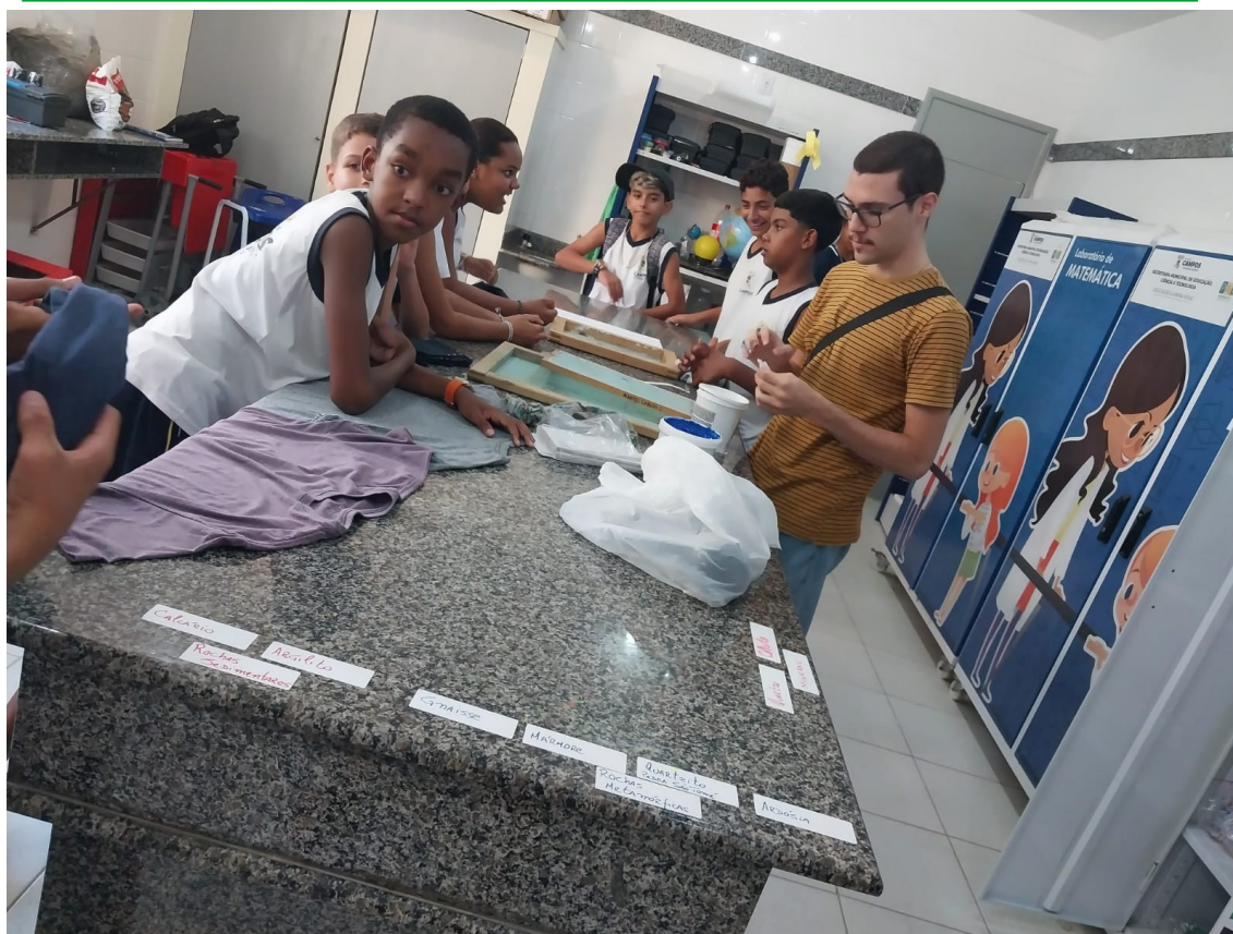
Figura 07 - Aluno apresentando o projeto de serigrafia na 29ª Semana do Saber Fazer Saber