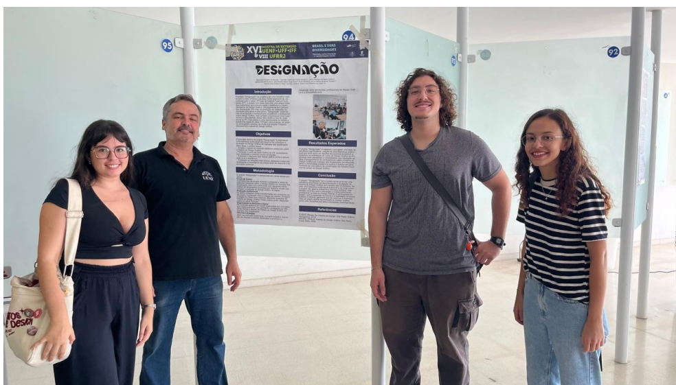
Figura 21 - Alunos com banner na XVI Mostra de Extensão UFF-UFF-UFF e VIII UFRRJ