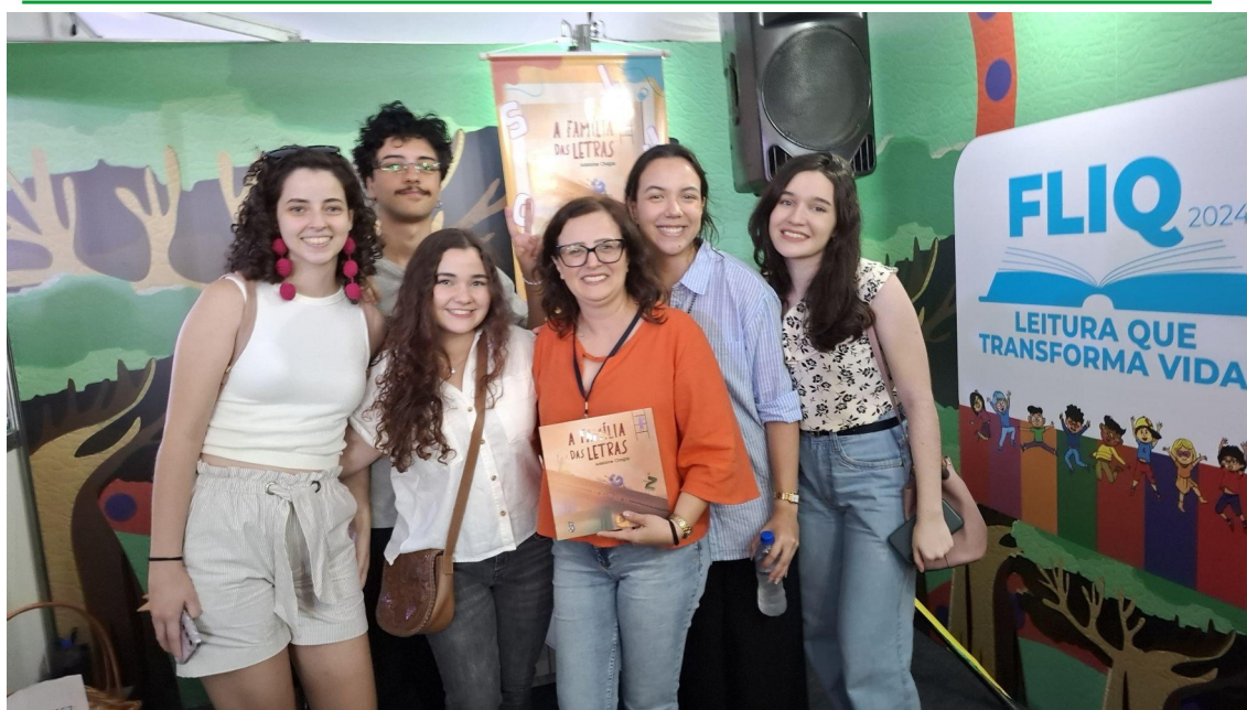
Figura 18 - Alunos e cliente no lançamento do livro “A família das letras” na Feira do Livro em Quissamã de 2024.