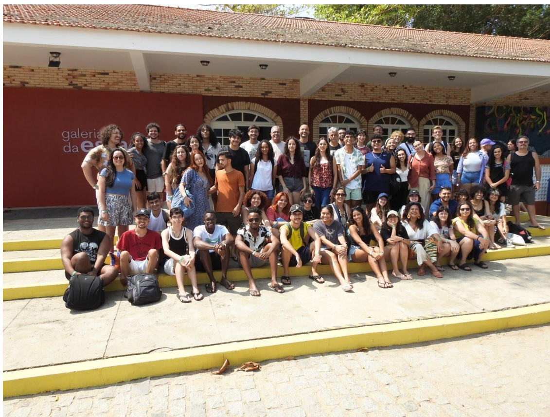
Figura 26 - Alunos e professores na exposição “Ribeirar”