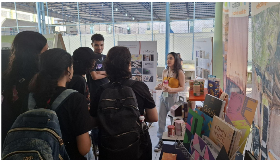
Figura 05 - Voluntários do Projeto Lex Design na 10ª Mostre-se

Apresentação dos trabalhos realizados pelo Laboratório Experimental de Design Gráfico (Lex Design) no evento 10ª Mostre-se. A MOSTRE-SE é realizada anualmente no Campus Campos Centro do Instituto Federal Fluminense, tendo como objetivo principal tecer uma rede permanente de comunicação dos setores produtivos locais e regionais com os estudantes em formação. Contou com a participação dos bolsistas e voluntários do Lex Design.