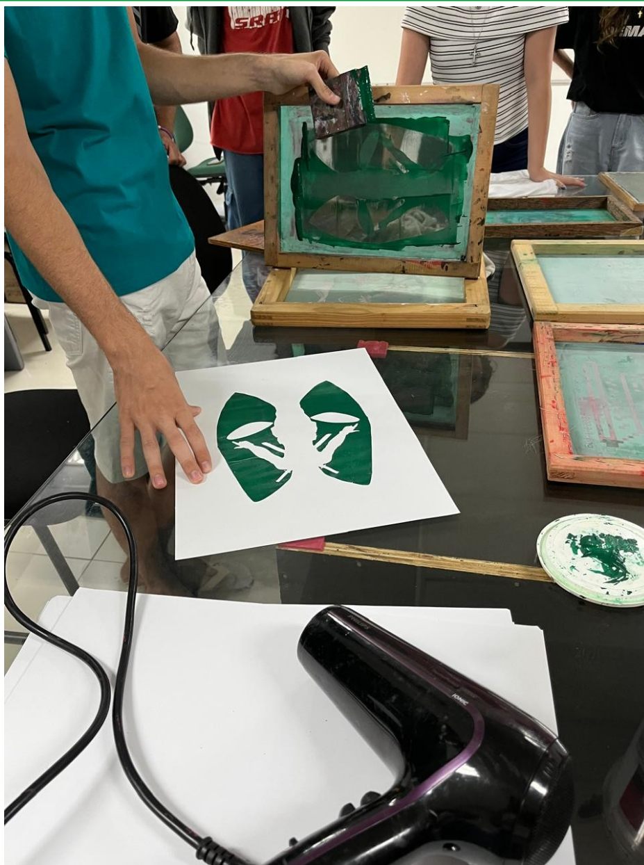
Figura 04 - Calouros na oficina de serigrafia

Evento realizado para acolher os estudantes que ingressaram no período letivo de 2024.2, onde realizou-se diversas atividades como oficinas, palestras e workshops. Evento realizado junto aos discentes membros do Centro Acadêmico. Contou com a participação de 91 alunos que