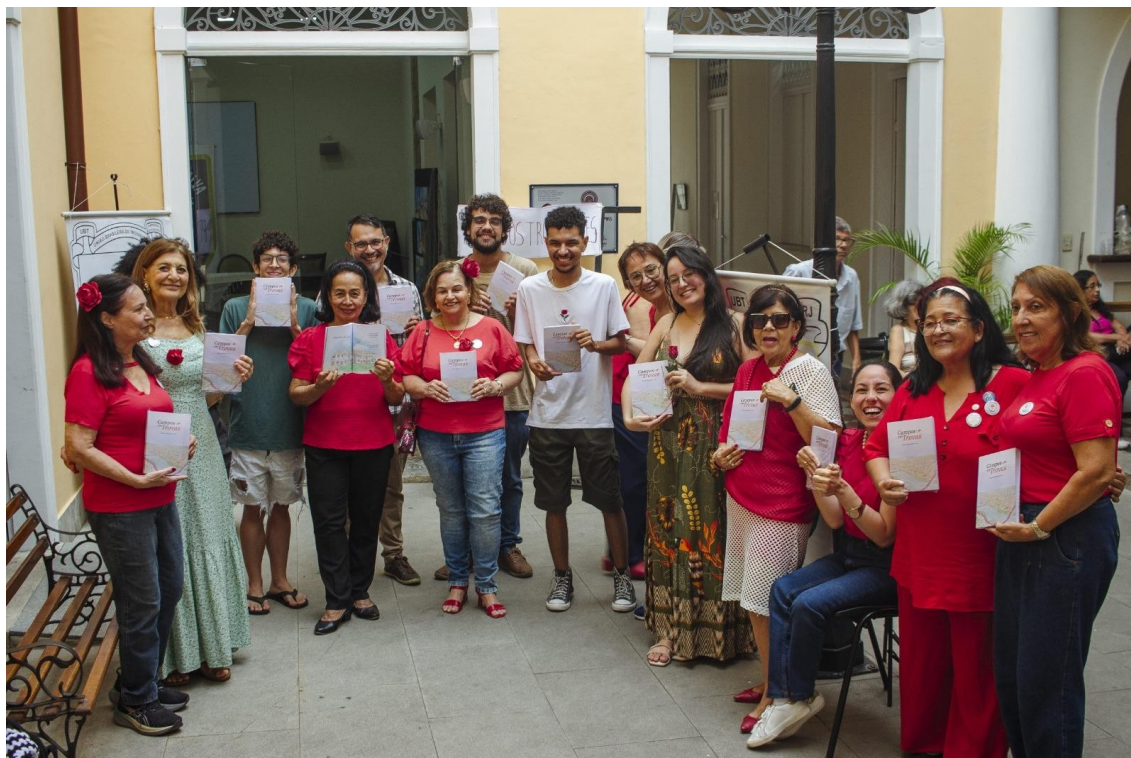
Figura 20 - Alunos no lançamento do livro “Campos em Trovas”