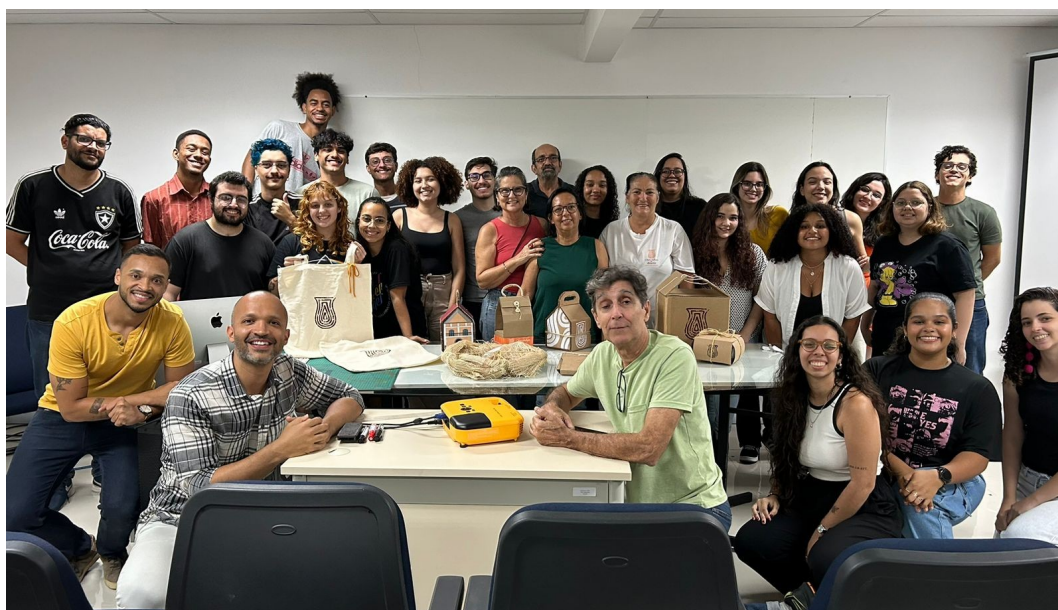
Figura 13 - Alunos, professores e clientes na apresentação das embalagens desenvolvidas.