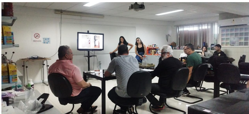
Figura 16 - Apresentação dos alunos para a banca de avaliação