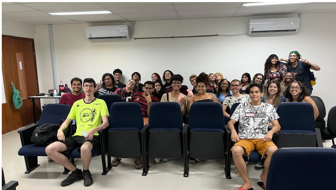
Figura 01 - Alunos no auditório para o evento Cine CARM - Edição Halloween

Link para o portal de eventos: https://eventos.iff.edu.br/cinecarm