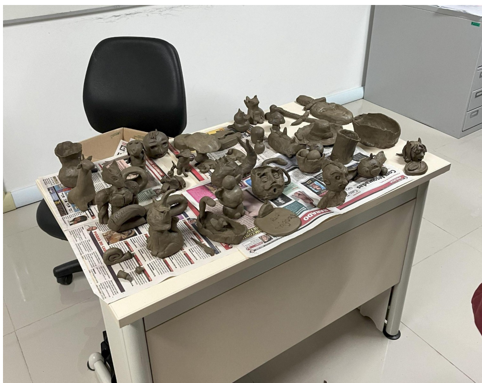
Figura 12 - Produção dos alunos e visitantes do projeto “A importância da argila na arte terapia”.