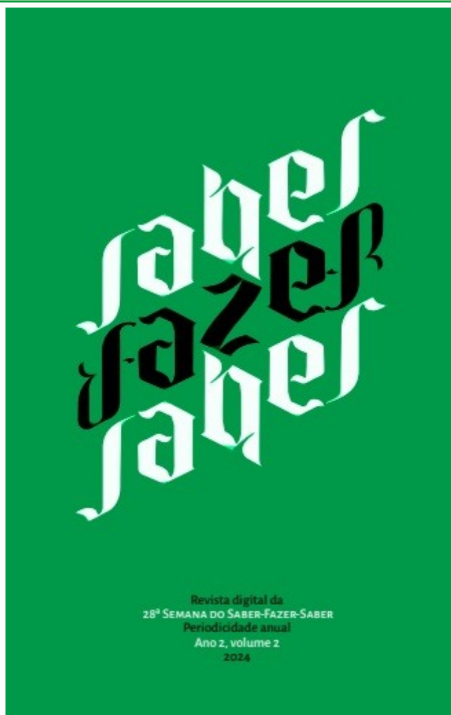
Figura 24 - Folha de Rosto da Revista da 28ª Semana do Saber Fazer Saber desenvolvida pelo Lex Design