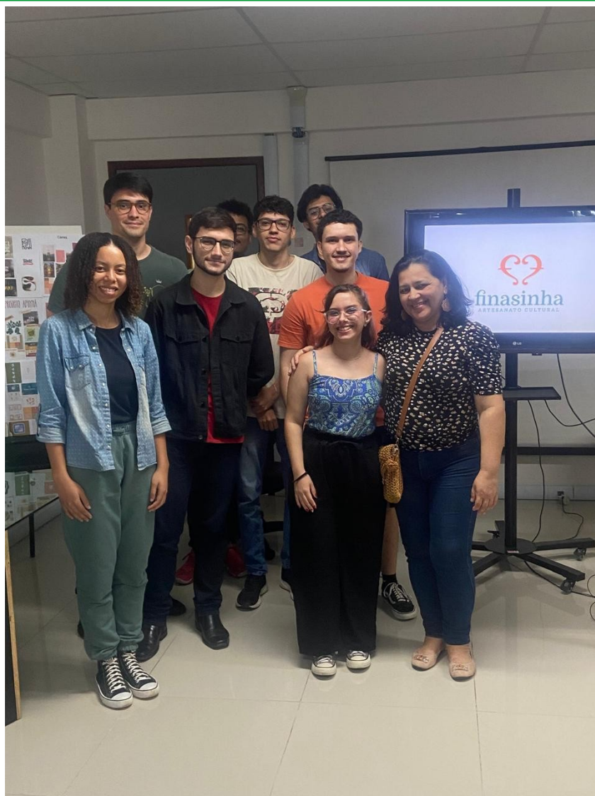
Figura 17 - Alunos e cliente na apresentação do projeto Finasinha.