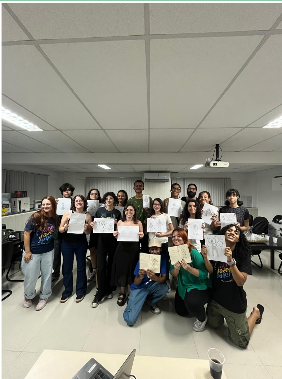
Figura 03 - Calouros na oficina de criação de personagem